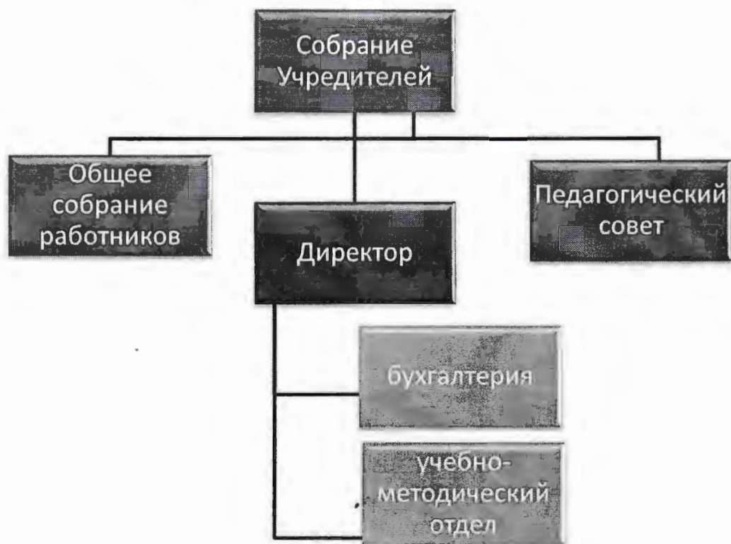
Рисунок 1. Структура и органы управления АНО ДПО «Академия профессионального образования и развития».

Организационно-правовое обеспечение управления образовательной организацией и осуществления образовательной деятельности осуществляется в соответствии с требованиями законодательства в сфере дополнительного образования, дополнительного профессионального образования и профессионального обучения, информация размещена на официальном сайте организации http://academy-balabanovo.ru/sveden/document .